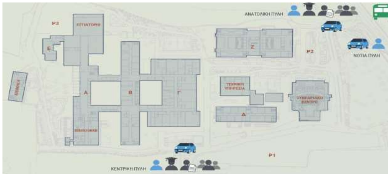
Εικόνα 2: Διάγραμμα κτιρίων Πανεπιστημιούπολης Αρχαίου Ελαιώνα

Το Τμήμα Κοινωνικής Εργασίας του ΠΑ.Δ.Α. στεγάζεται στην Πανεπιστημιούπολη Αρχαίου Ελαιώνα, στο Κτίριο Δ' και Ε' (Θηβών 250, Αιγάλεω, Τ.Κ. 12244). Οι κύριες πύλες της Πανεπιστημιούπολης, όπου βρίσκονται τα Κτίρια Δ' και Ε', είναι τρεις, μία επί της λεωφόρου Θηβών και δύο επί της λεωφόρου Πέτρου Ράλλη.