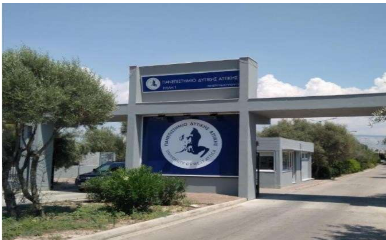
Εικόνα 1: Κεντρική είσοδοσ Πανεπισημιούπολησ Αρχαίου Ελαιώνα επί τησ Θηβών 250